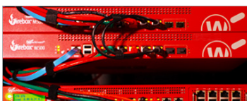
Seguridad de red