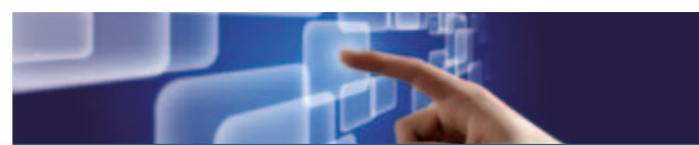
IMAGEN Y SONIDO N° HORAS